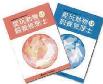
▲2級愛玩動物飼養管理士教本