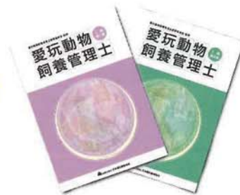
▲1級愛玩動物飼養管理士教本