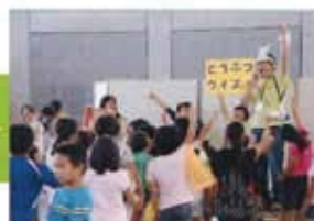
子どもたちへの教育 イベントでの動物クイズ(福井)