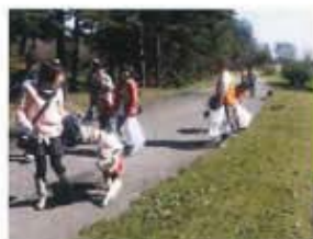
適正飼養の普及啓発活動 クリーンアップ活動(栃木)