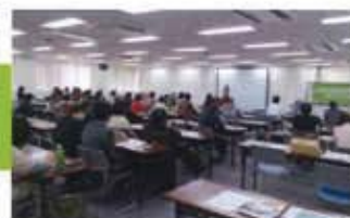
勉強会・講習会などの開催 市民向け公開セミナー(福岡)