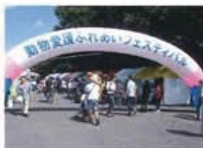
国及び地方自治体の事業への協力 動物愛護週間中央行事(環境省)