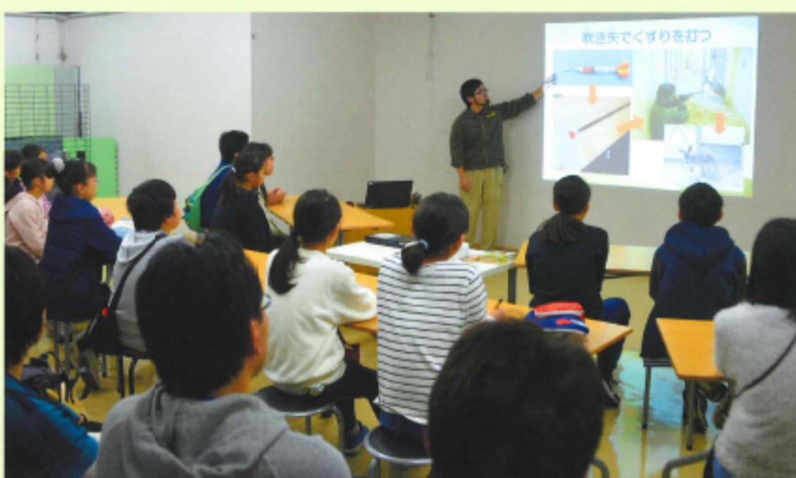
動物園で獣医さんからお話を聞いている様子 ((公財)東京動物園協会 提供)