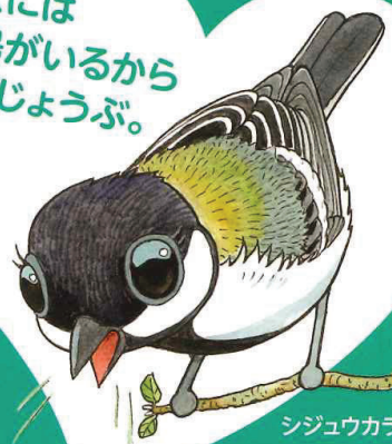
シジュウカラの親

ヒナを見つけ、 放っておけないと 判断された場合は、 各都道府県の 鳥獣保護担当部署に ご連絡ください。