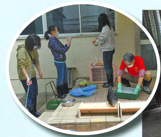
ウサギとチャボのお世話の様子。 おやじの会つながりで卒業生 も手伝いに来てくれました。

ことし はる しんがた 今年の春、新型コロナウイルス感染対策で学校が臨時休校 になりました。西東京市立保谷第二小学校では、平日は先生、 きゅうじつ かい ちゅうしん ひと ちいき ひと きょう 休日はおやじの会が中心となって、おうちの人や地域の人も協 りょく どうぶつ せわ 力して動物のお世話をしました。大人の心にも「命の学び」が しっかりと根付いているからこそこの活動であり、子供たちに とってさいりょう てほん とって最良のお手本となっています。