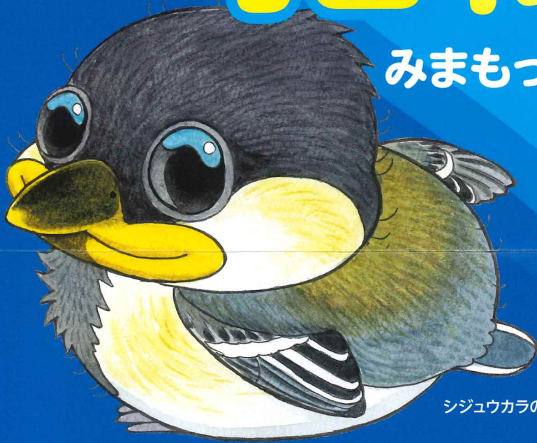
シジュウカラのヒナ